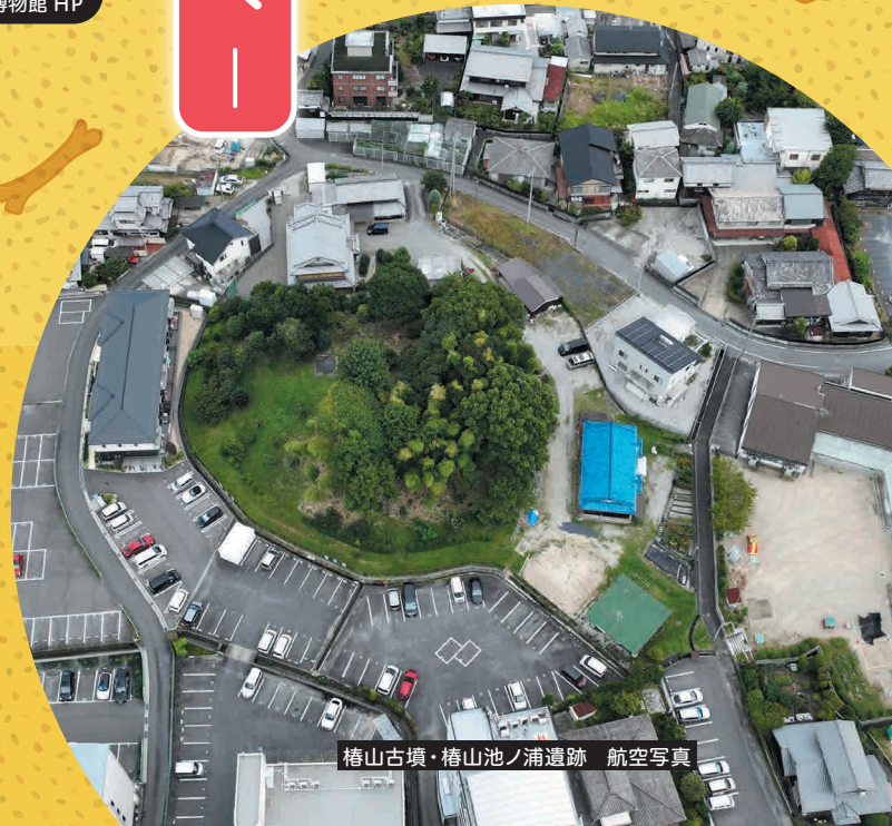
椿山古墳・椿山池ノ浦遺跡 航空写真