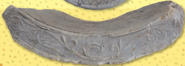
蜂屋遺跡 法隆寺式軒瓦