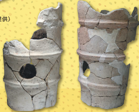
小柿遺跡 円筒埴輪