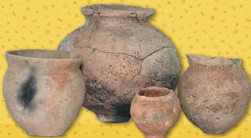
霊仙寺遺跡 土師器