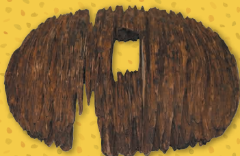
椿山古墳 笠形木製品