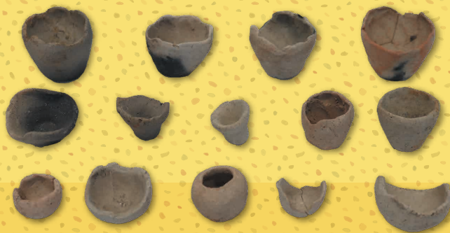
小柿遺跡 手づくね土器