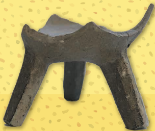
椿山池ノ浦遺跡 三足壺