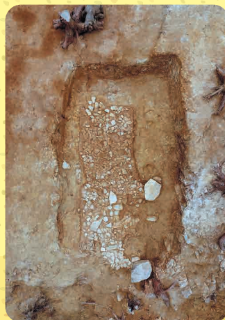
北尾遺跡 A-1号墳石室