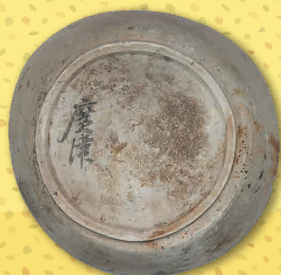
霊仙寺遺跡 「廣津」墨書土器