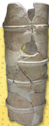
小柿遺跡 円筒埴輪