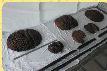
椿山古墳 笠形木製品