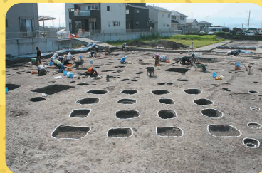
霊仙寺遺跡 高床倉庫